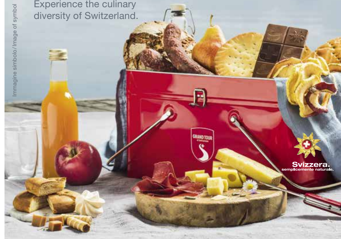
Immagine simbolo / Image of symbol

Experience the culinary diversity of Switzerland.