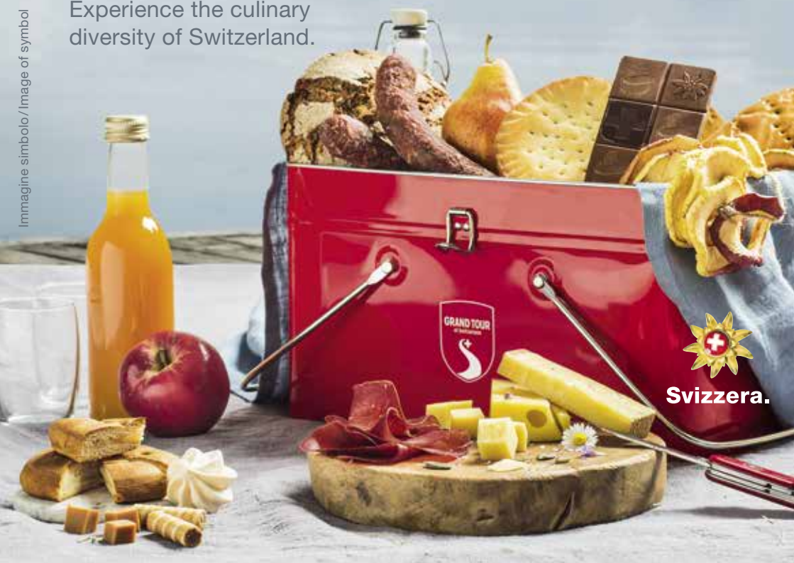
Immagine simbolo / Image of symbol

Experience the culinary diversity of Switzerland.